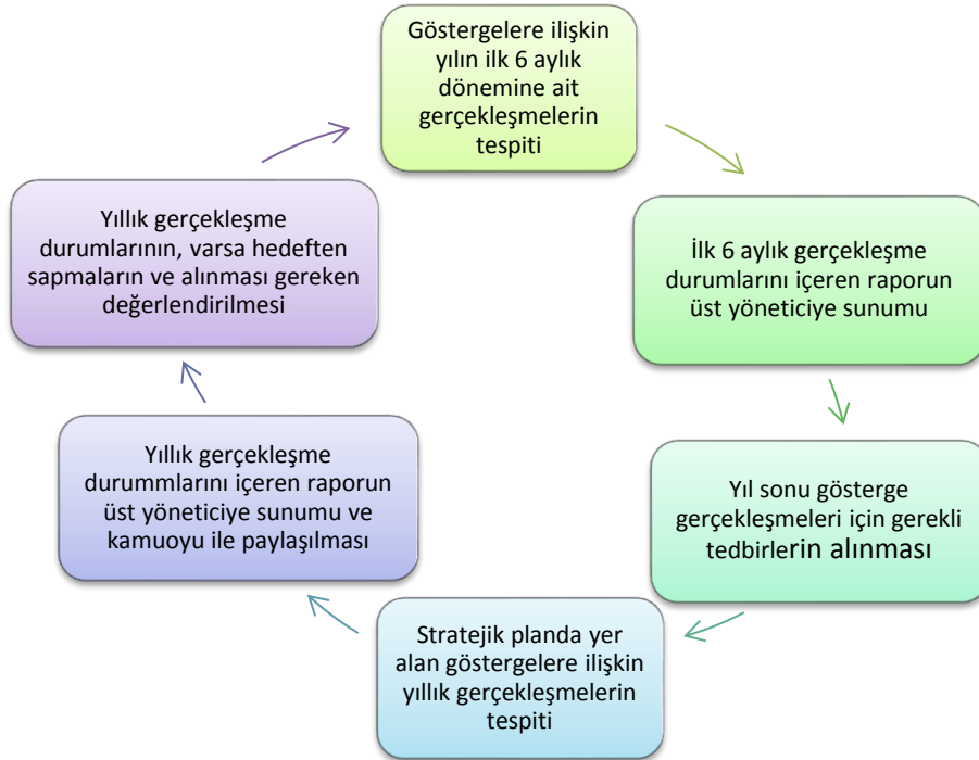
Şekil 3: İzleme ve Değerlendirme Modeli Şeması

Yılın tamamını kapsayan ikinci izleme dâhilinde; Müdürlüğümüz strateji geliştirme birimi tarafından performans programlarında yer alan performans göstergelerinin yıl sonu gerçekleşme durumları tespit edilecektir. Yıl sonu gerçekleşme durumları, varsa gösterge hedeflerinden sapmalar ve bunların nedenleri üst yönetici başkanlığında birim yöneticilerinin de değerlendirilerek gerekli tedbirlerin alınması sağlanacaktır.