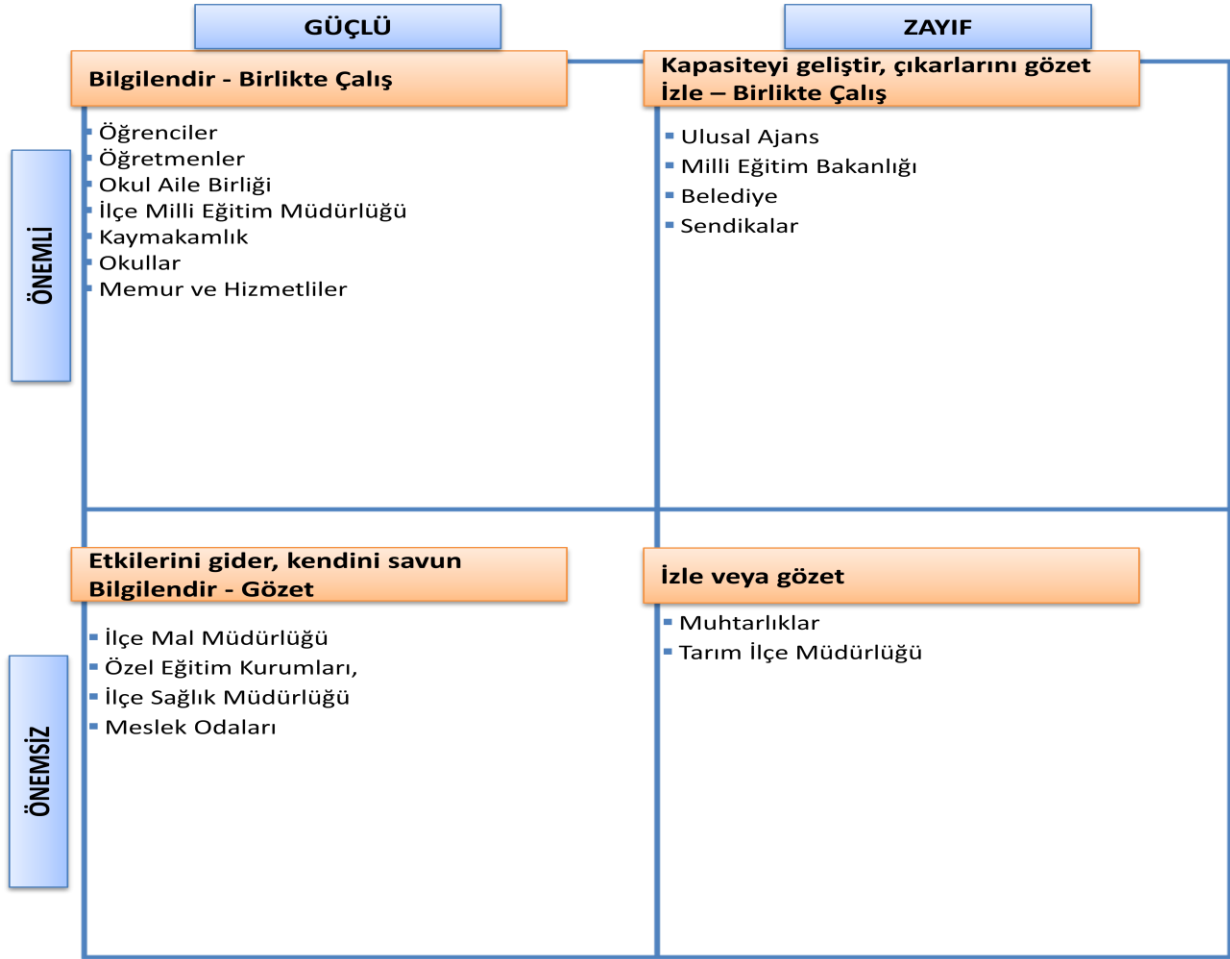
Şekil 2: PAYDAŞ STRATEJİSİ

Önceliklendirilen paydaşlar bu aşamada kapsamlı olarak değerlendirilir. Paydaşlar değerlendirilirken cevap aranabilecek sorular şunlardır: